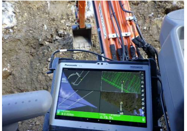
杭ナビショベル及び快測ナビの並行使用による施工例